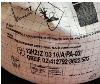
Marchi di fabbricazione e di conformità