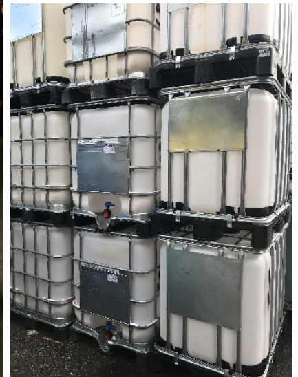
Contenitori intermedi per il trasporto alla rinfusa