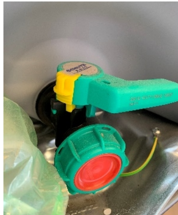
Stato e equipaggiamenti di servizio