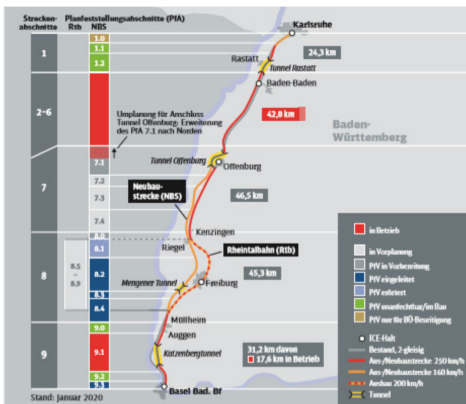
Figure : Aménagements de tronçons et nouveaux tronçons Karlsruhe–Bâle, état de la planification et de la réalisation janvier 2020 ;

L'Allemagne a déjà réalisé l'aménagement à quatre voies sur certaines sections. D'autres sections subissent des retards par rapport à ce qui avait été initialement prévu en raison des nombreuses oppositions de la part des riverains concernés. Un aménagement ininterrompu à quatre voies entre Karlsruhe et Bâle devrait être terminé aux alentours de 2040.