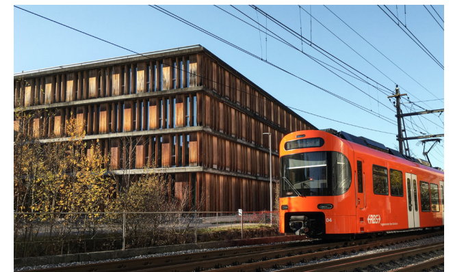
Le bâtiment actuel de l'OFT, situé à Ittigen et jouxtant la ligne ferroviaire du RBS.